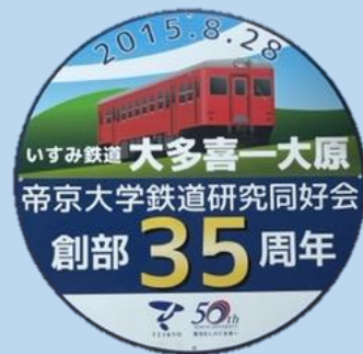
創部35周年記念貸切ヘッドマーク（2015年）