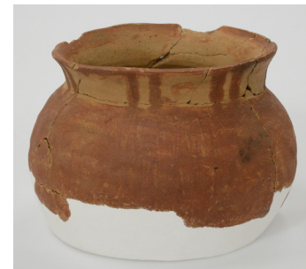
赤綵球胴釜 9世紀（由帝京大學保管）

其中，上原遺址出土的北東北地區固有土器「赤綵球胴釜」是證明東北人民在8世紀後期至9世紀前期被當作「俘囚/夷俘」強行遷徙到他國的重要資料。