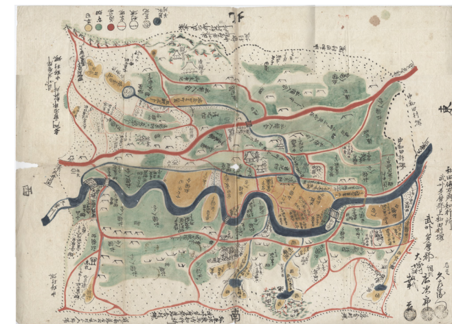
大塚村村繪圖 江戶時代（個人收藏）