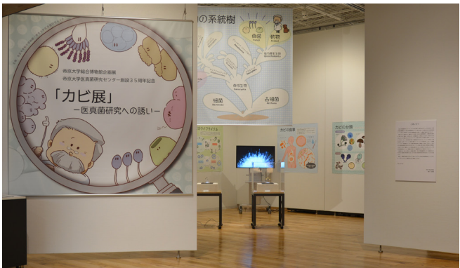
위 : 테이쿄 대학 의진균 연구 센터 설립 35주년 기념 '곰팡이전' - 의진균학 연구로의 초대 - 왼쪽 : 캠퍼스 유적 발견전 '고대 다마에 살았던 에미시의 수수께끼를 쫓아라'