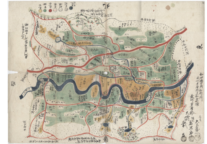
오쓰카무라 마을 그림지도 에도 시대 (개인 소장)