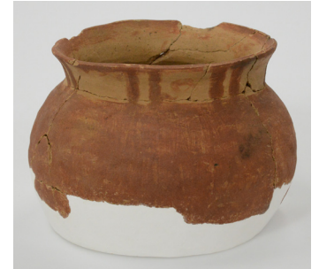
세키사이큐도가메 9세기 (테이쿄 대학 보관)

그 중에서도 우와타라 유적에서 출토된 북동북 고유의 토기인 '세키사이큐도가메'는 8세기 후반에서 9세기 전반에 '후슈·이후'로서, 당시의 동북민이 타국에 강제 이주당한 것을 나타내는 자료입니다.