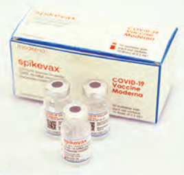
モデルナ社製ワクチン