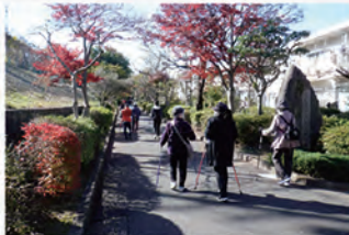
八王子市でのフレイル予防の取り組み