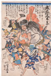
芳艷《麻糬送出しの図》1863年 内藤記念くすり博物館所蔵