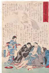
橋本直義《流行虎列刺病予防の心得》1877年 内藤記念くすり博物館所蔵